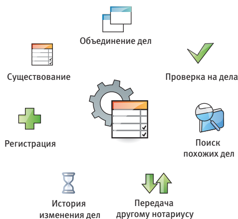
Рис. 1. Концепция работы

Централизованный учет наследственных дел – программное решение, которое позволяет хранить все наследственные дела централизованно и предоставляет возможность нотариусам выполнять все необходимые действия с рабочего места.